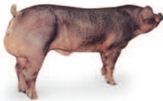
V-300 Mâle Terminal