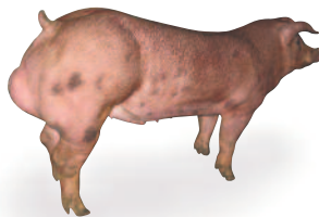
G Performer 4.0 Mâle Terminal