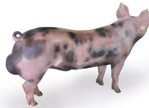
G Performer 6.0 Mâle Terminal