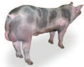
G Performer 8.0 Mâle Terminal