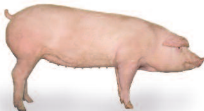
Fertilis 25 Femelle Commerciale