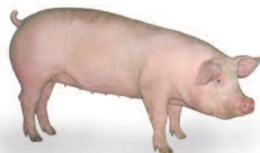
Fertilis 40 Femelle Commerciale